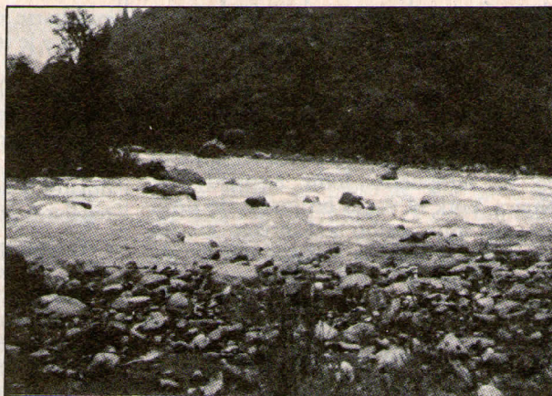
El Vado Viejo: donde habría desaparecido el extranjero